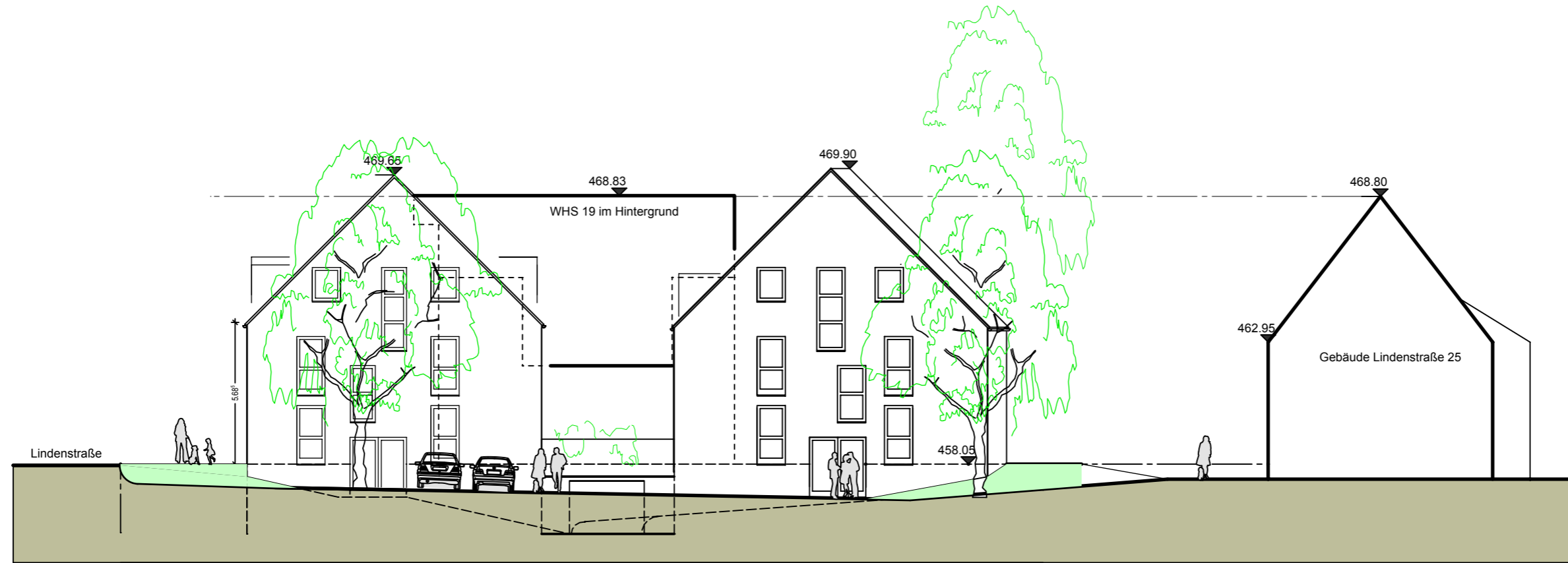
NORD - OST ANSICHT